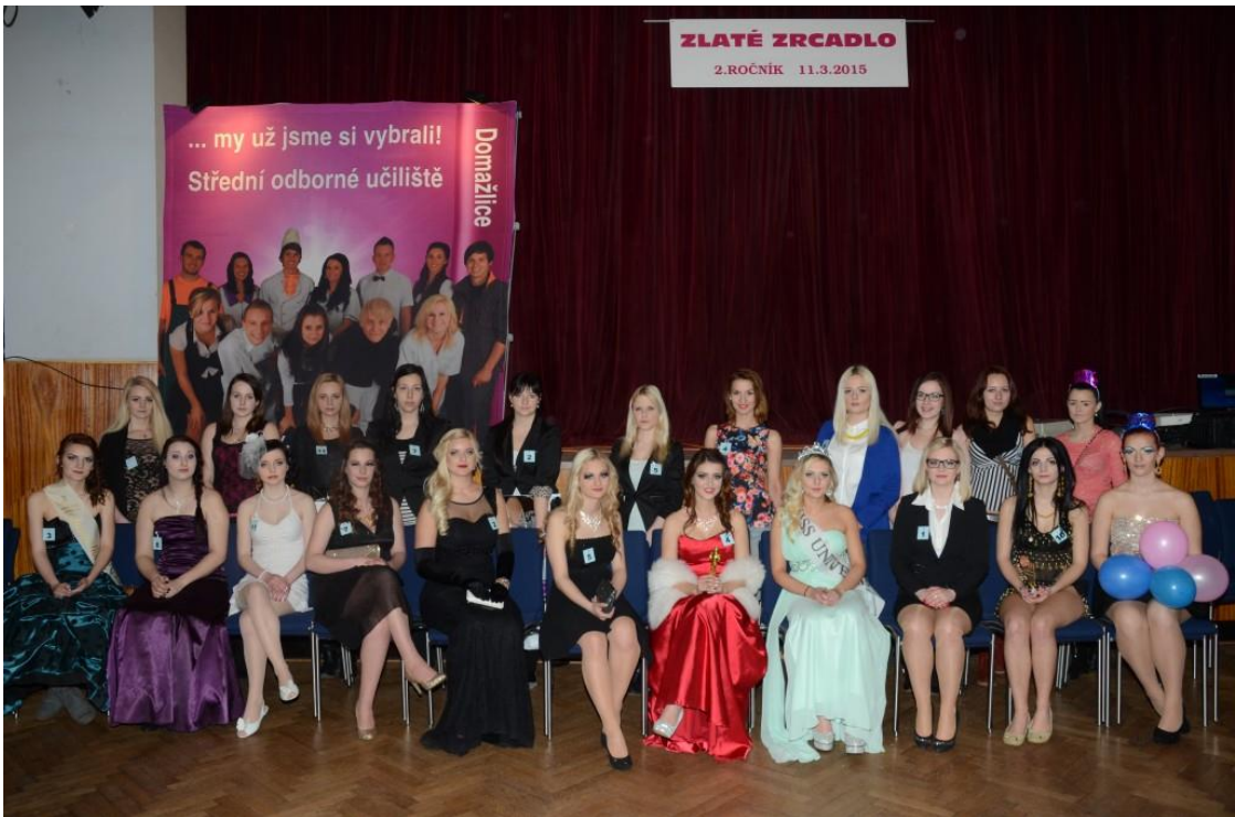
Fotografie zúčastněných kosmetiček a jejich modelek.