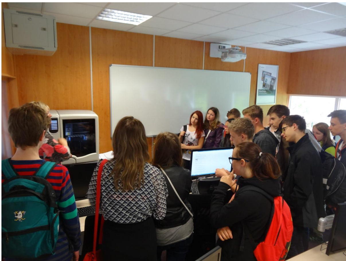
Nová učebna programování s 3 D tiskárnou vlevo. Žáci se seznamují s principem a fungováním 3 D tiskárny.