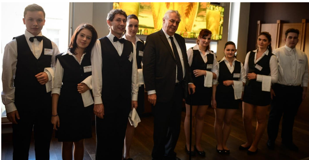
Naši žáci obsluhovali prezidenta ČR Miloše Zemana při slavnostním obědě v restauraci Dubina při návštěvě Domažlic 5. března 2015