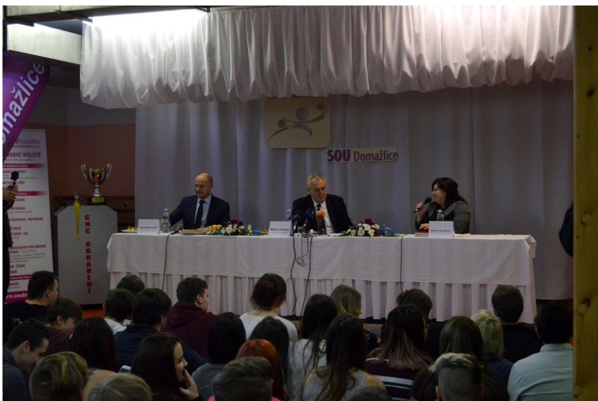
Ředitelka školy krátce představila žáky Středního odborného učiliště Domažlice.