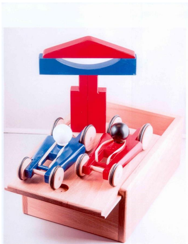
Vítězná dřevěná autíčka s pohonem, která vyrobil Zdeněk Staš, žák 2. ročníku oboru truhlář a získal titul Zlaté české ručičky 2016