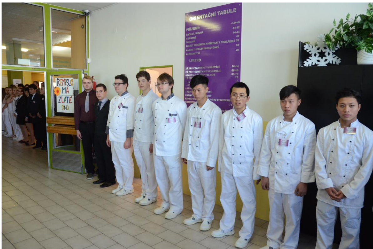
Žáci oboru gastronomie a kuchař – číšník připravili pro pana prezidenta a jeho doprovod čestnou uličku.