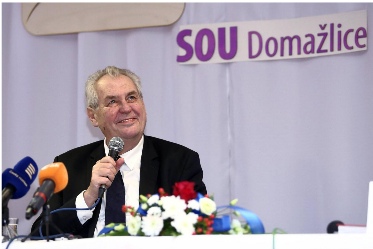
Prezident republiky Miloš Zeman při debatě se žáky Středního odborného učiliště Domažlice v prostorách cvičebního sálu.