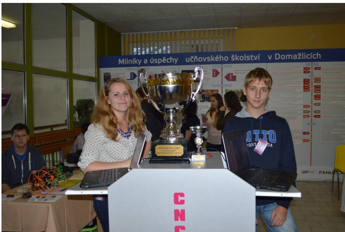
Prezentace úspěchů strojírenských oborů na DOD 14.-16.11.2016