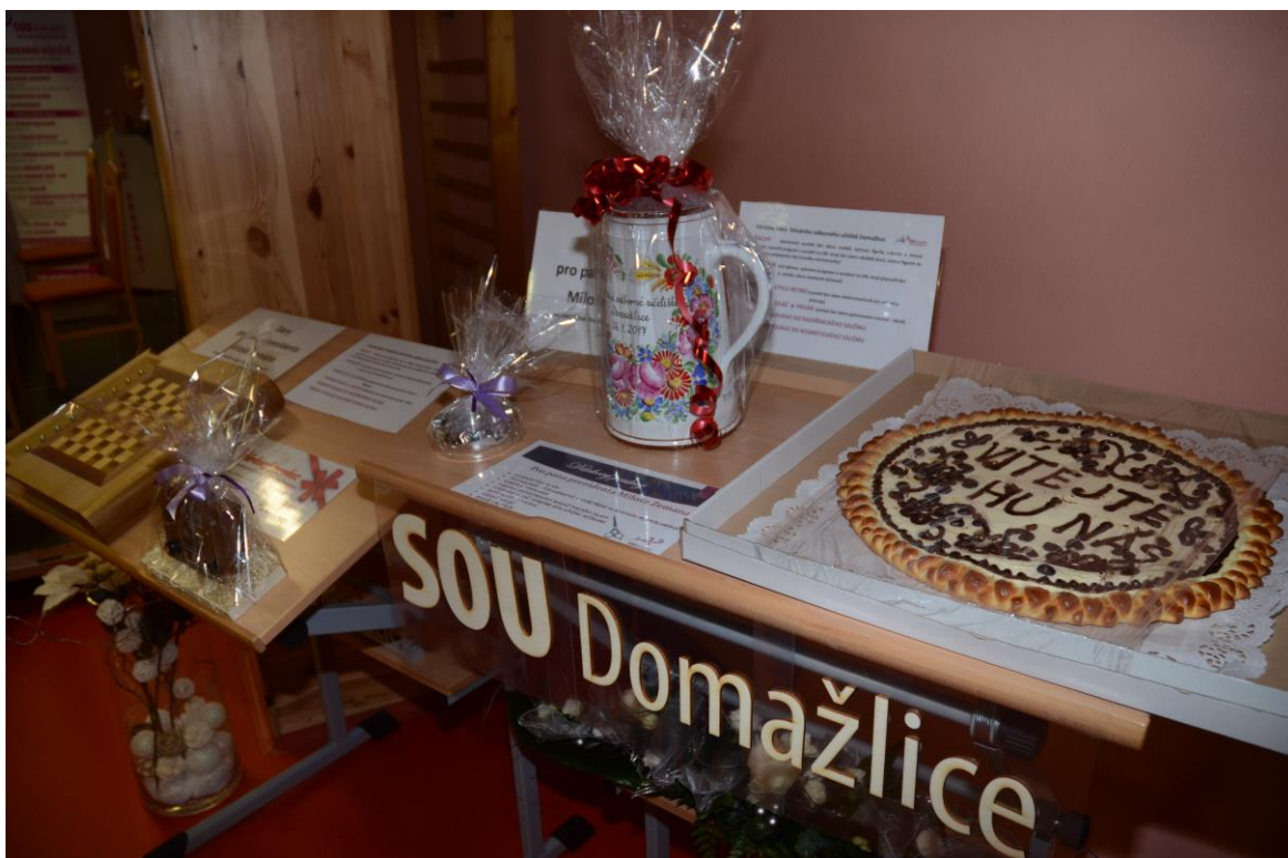
Přehled darů, které si pro pana prezidenta Miloše Zemana připravili žáci jednotlivých oborů vzdělání.