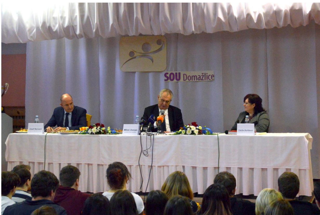
Prezident republiky Miloš Zeman odpovídá na různé dotazy žáků Středního odborného učiliště Domažlice.