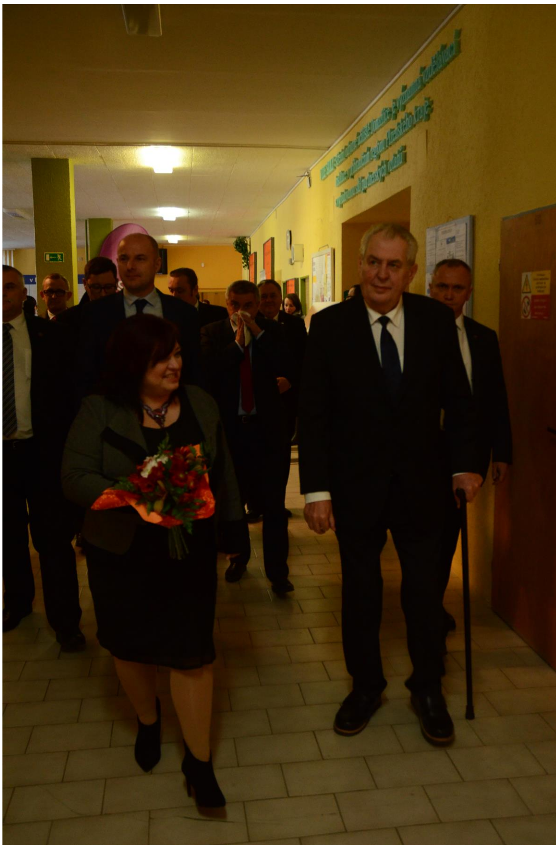
Prezident republiky přichází k učebně, ve které proběhne beseda s řediteli SŠ.