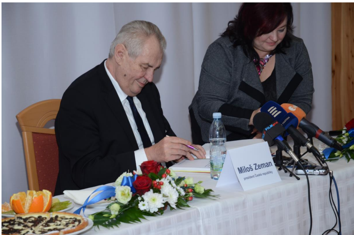
Prezident republiky Miloš Zeman se podepisuje do pamětní knihy Středního odborného učiliště Domažlice.