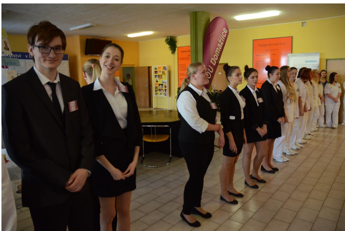
Čestnou uličku vytvořili i žákyně oboru kadeřník.