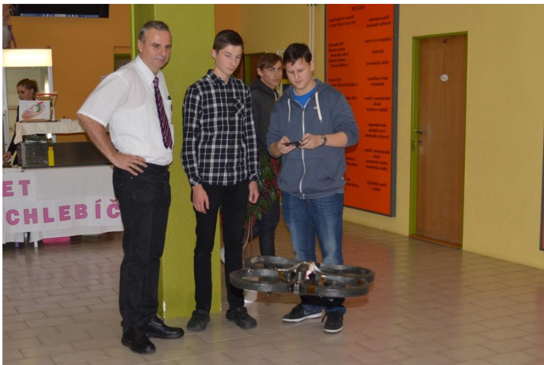
Prezentace elektrooborů na DOD 14.-16.11.2016, ukázka dronu.