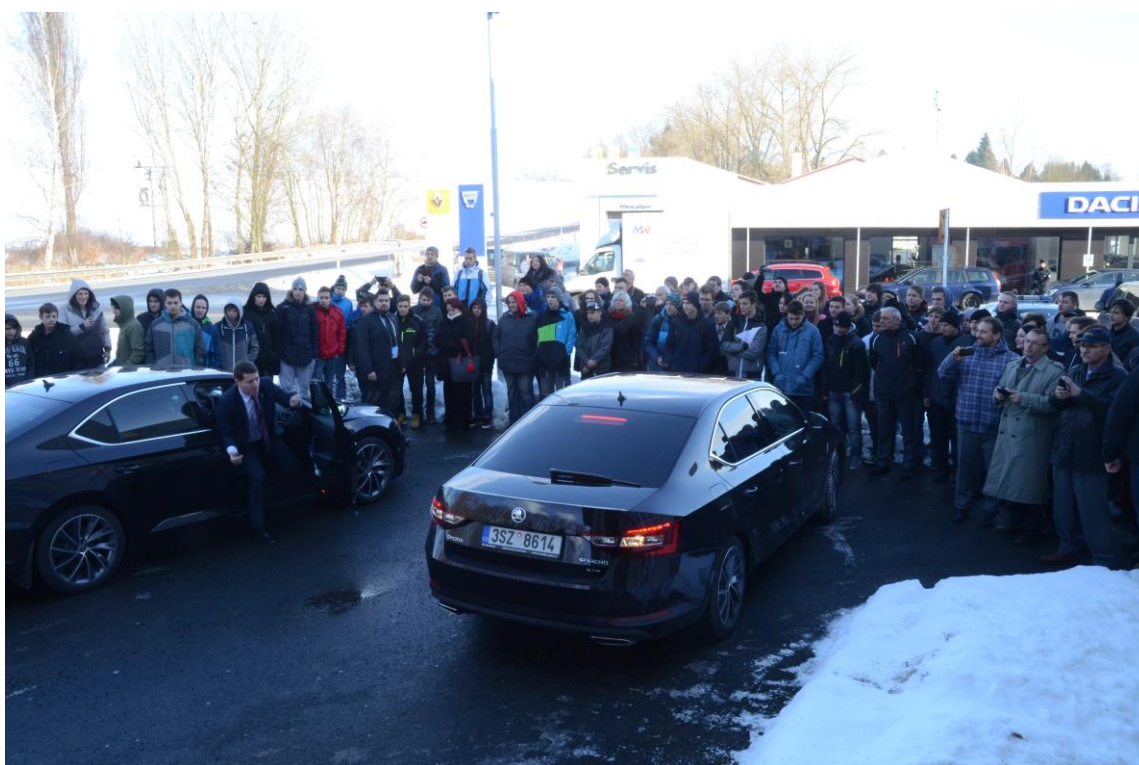
Příjezd prezidentské kolony před budovu Středního odborného učiliště Domažlice