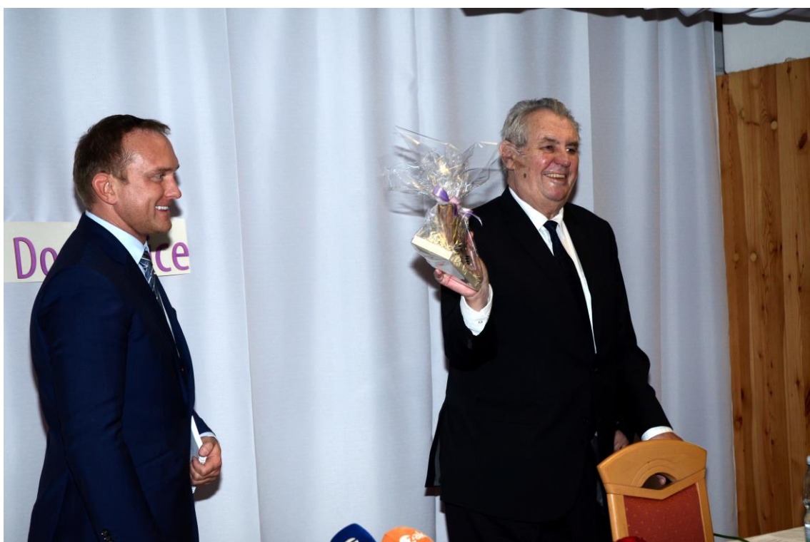
Pan prezident ukazuje sestavené rádio v retro stylu.