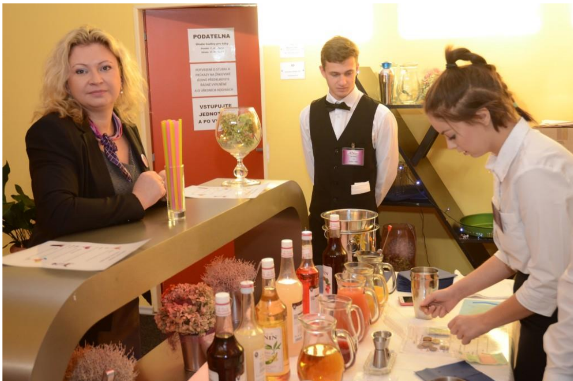
Ukázka barmanských dovedností