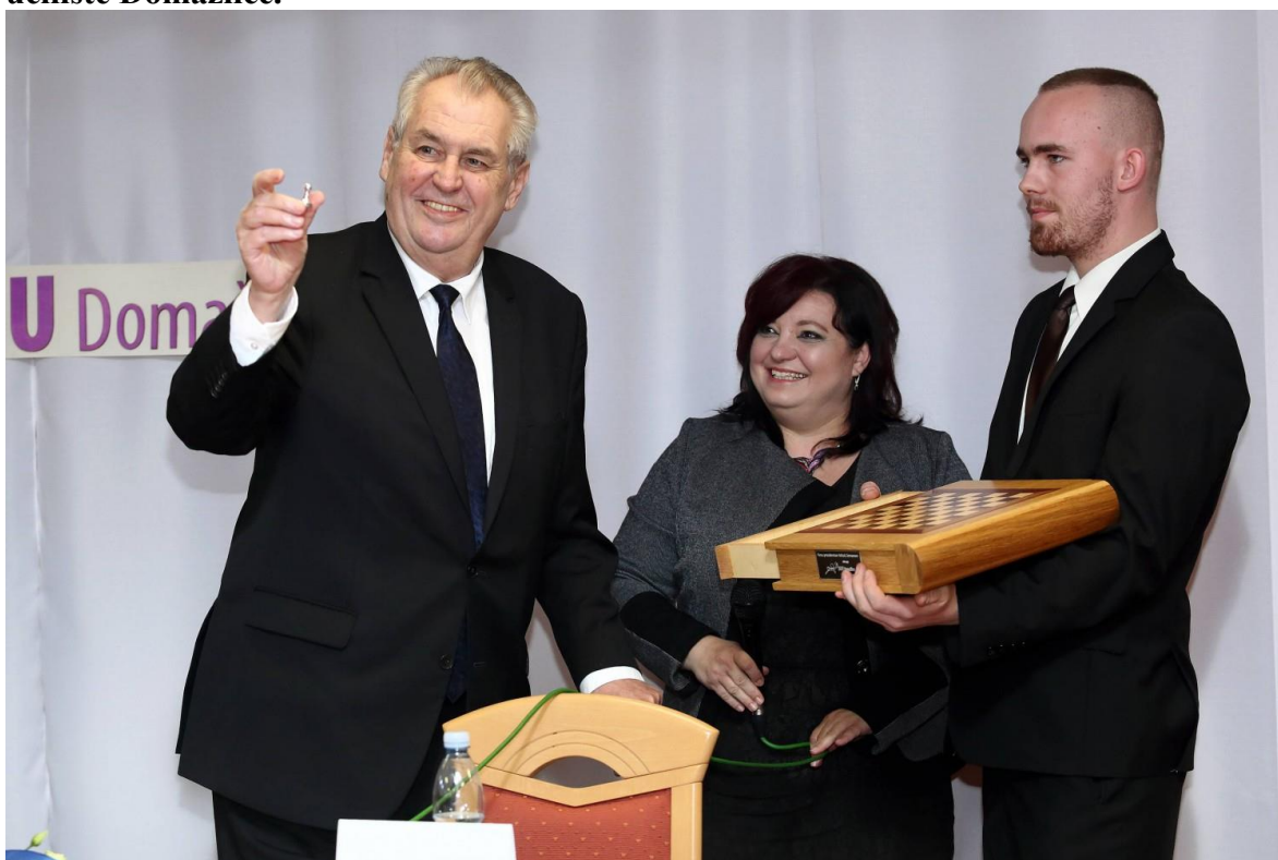
Prezident republiky Miloš Zeman ukazuje pěšce. Milan Polák, žák 3. ročníku oboru truhlář, vítěz republikového kola Enersol, projekt Srub – ekologické bydlení představil na mezinárodním kole soutěže Enersol, předává panu prezidentovi šachovnici, kterou vyrobili žáci oboru truhlář intarzií, šachové figurky z duralu a mosazi vyrobili na CNC stroji žáci oboru mechanik seřizovač a obráběč kovů a v rámci kroužku mechatroniky připravili z tvrzeného polystyrénu na drátořezu výplň pro uložení šachových figurek.