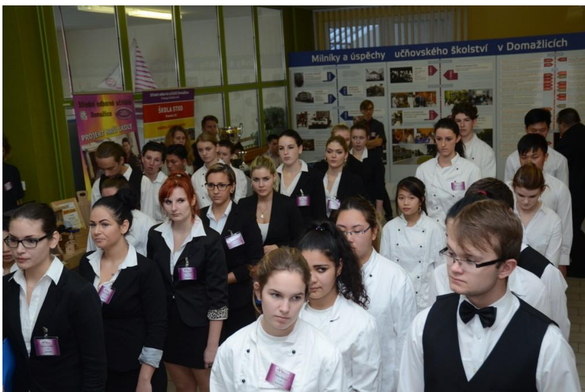
Ze slavnostního nastoupení kuchařů – číšníků a gastronomů při gastronomickém dnu otevřených dveří 14.11.2016.