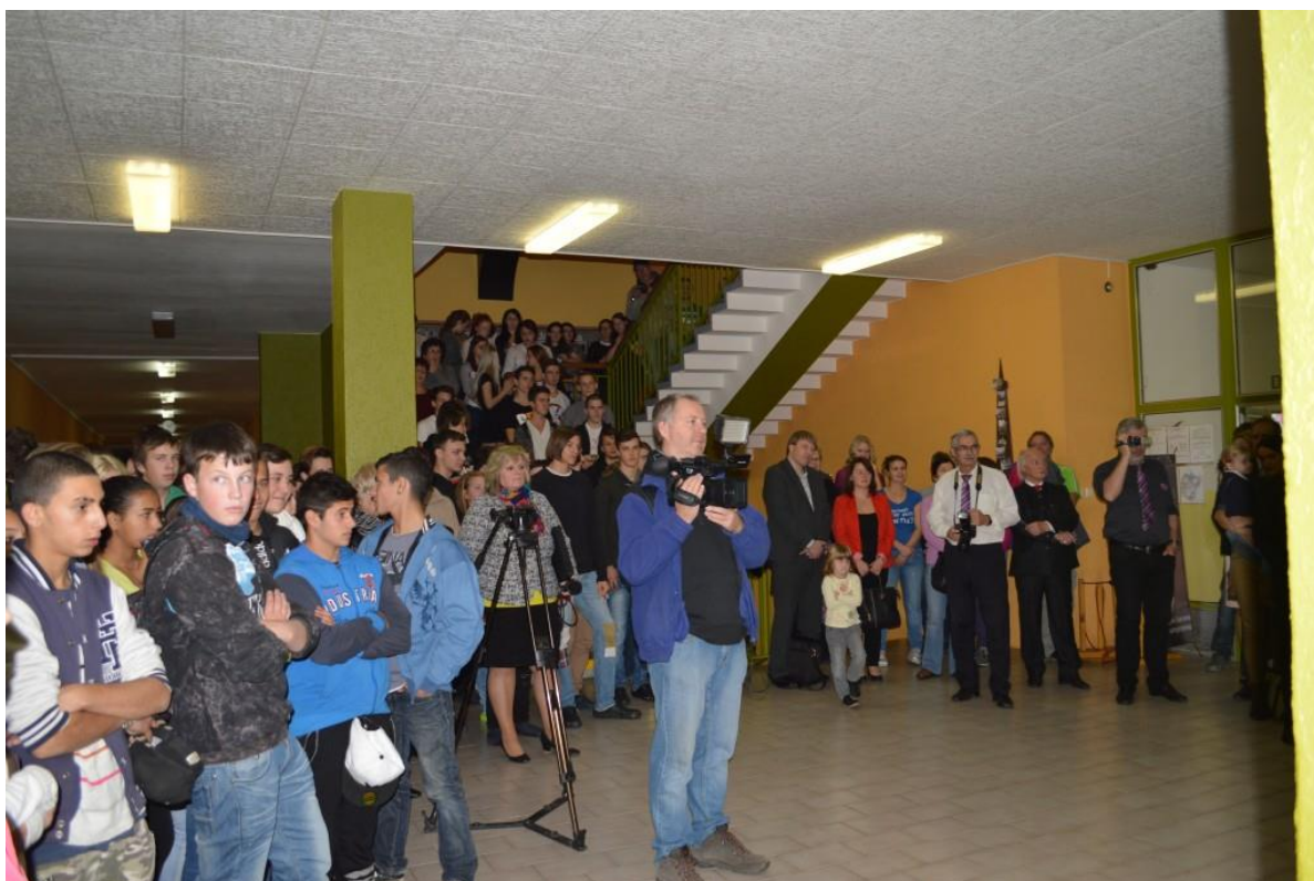
Žáci ze základních škol sledují vystoupení kadeřnic, kosmetiček, kuchařů – číšníků a gastronomů.