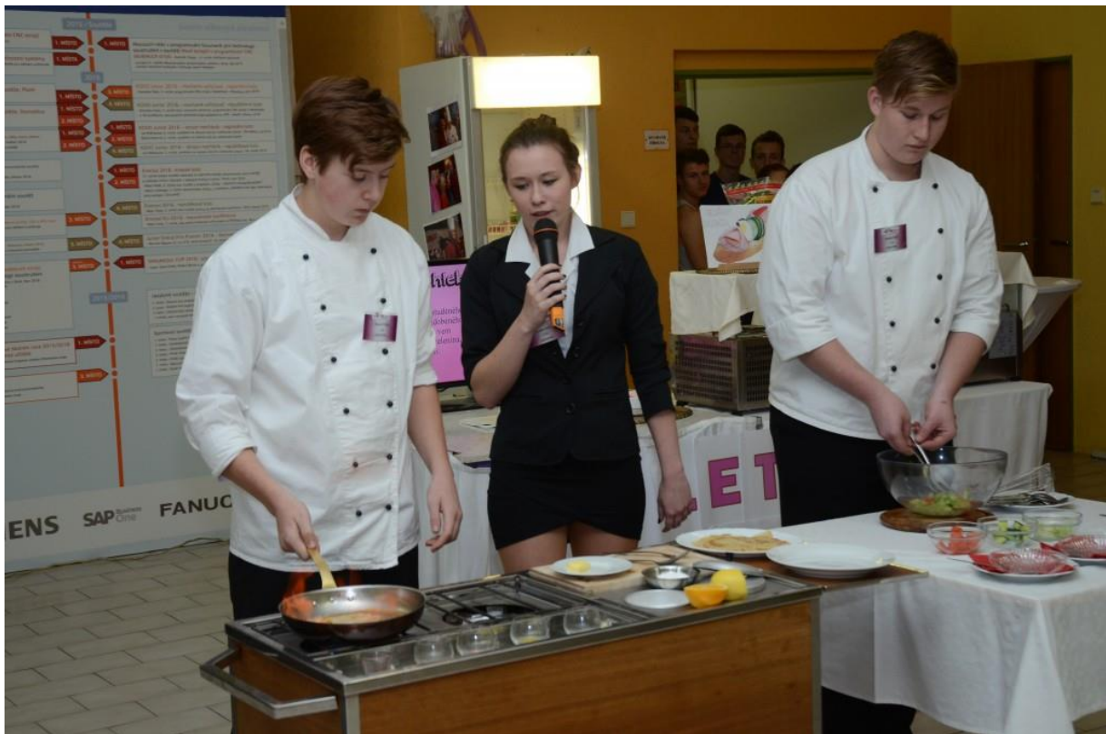
Praktické ukázky – flambování palačinek