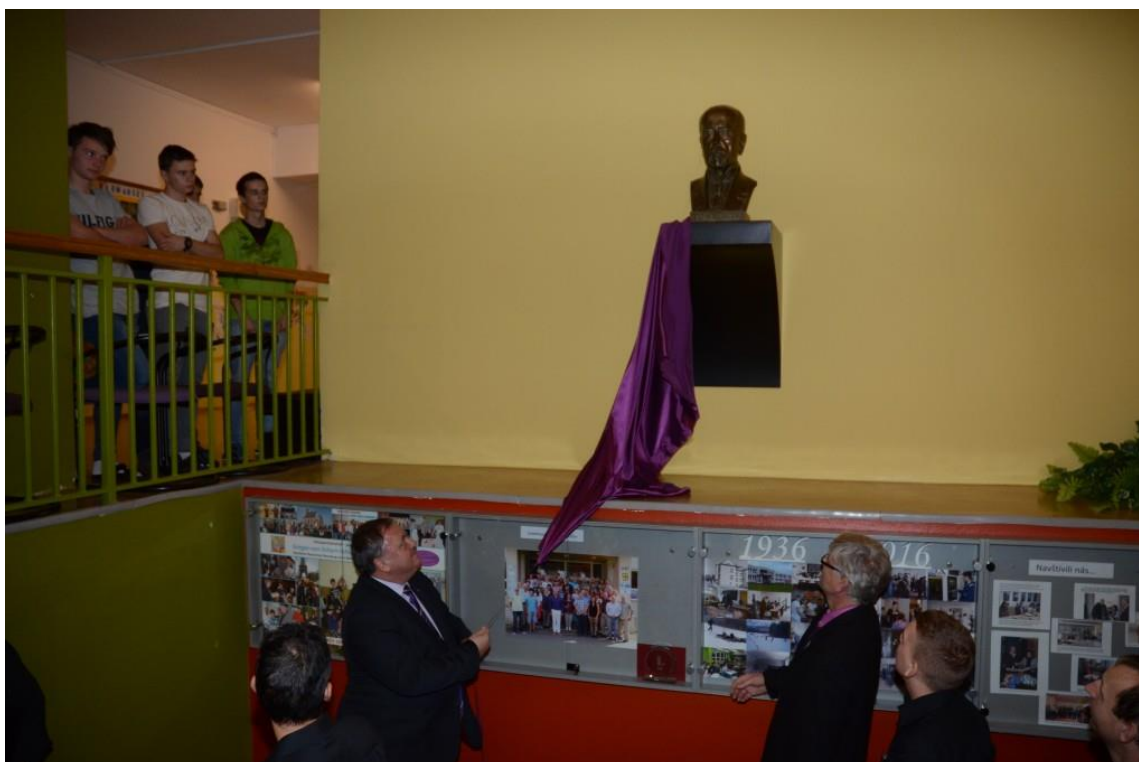
Ze slavnostního odhalení nového podstavce sochy T. G. Masaryka, který vyrobili žáci oboru strojní mechanik u příležitosti 80. výročí postavení první budovy školy, jež nesla název Jubilejní Masarykova odborná škola živnostenská 1936 – 2016.