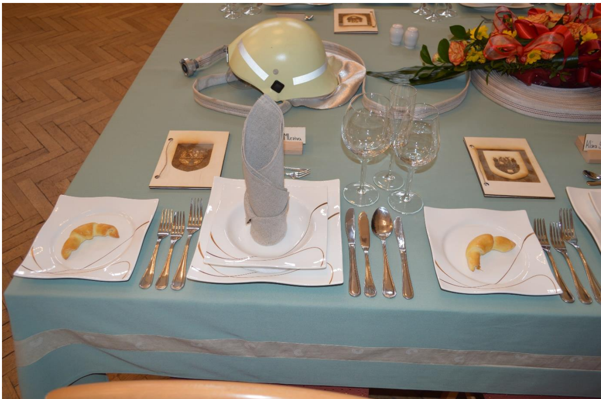
Stříbrná tabule se soutěže Stolničeni na téma „100 let od založení Svazu dobrovolného hasičstva“