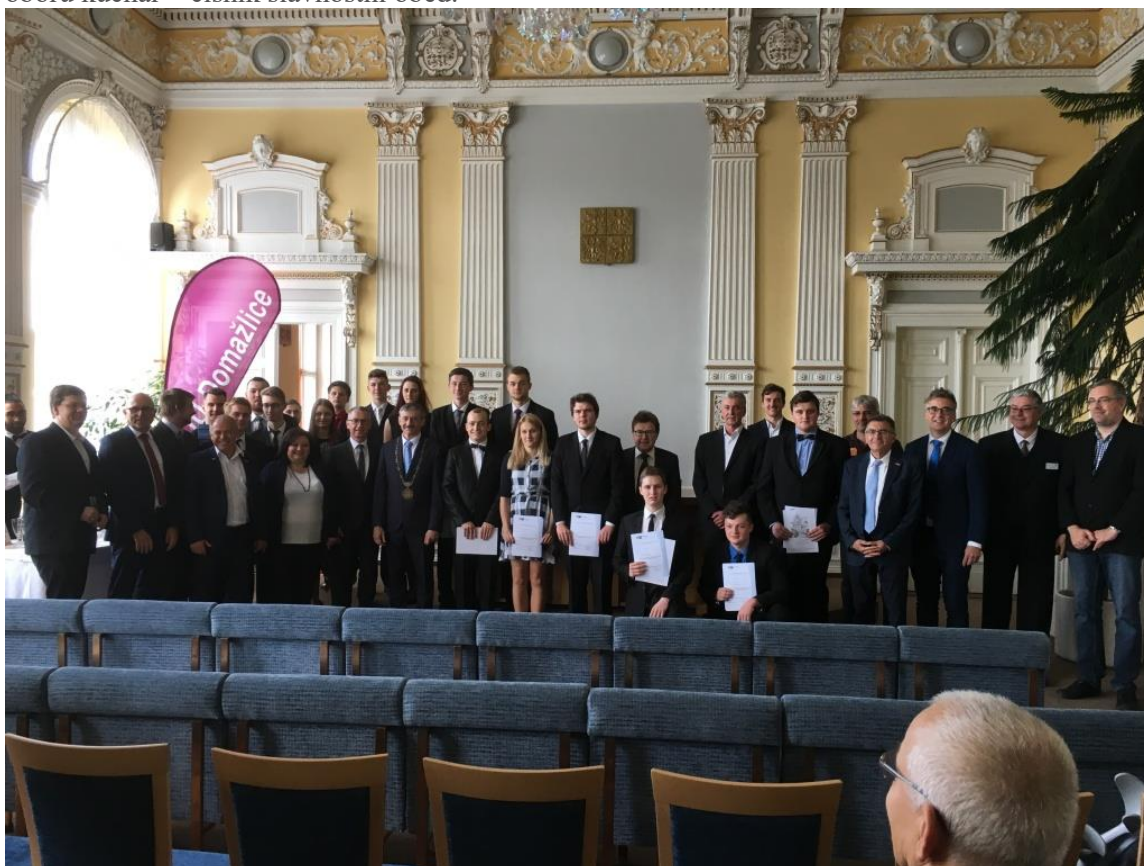
23. května 2019 byly v obřadní síni domažlické radnice již 5. rokem slavnostně předány Certifikáty Německé průmyslové a obchodní komory IHK a Krajského svazu řemeslníků KHW za účasti Berufsschule Cham. Certifikáty převzalo 18 žáků oborů mechanik seřizovač,