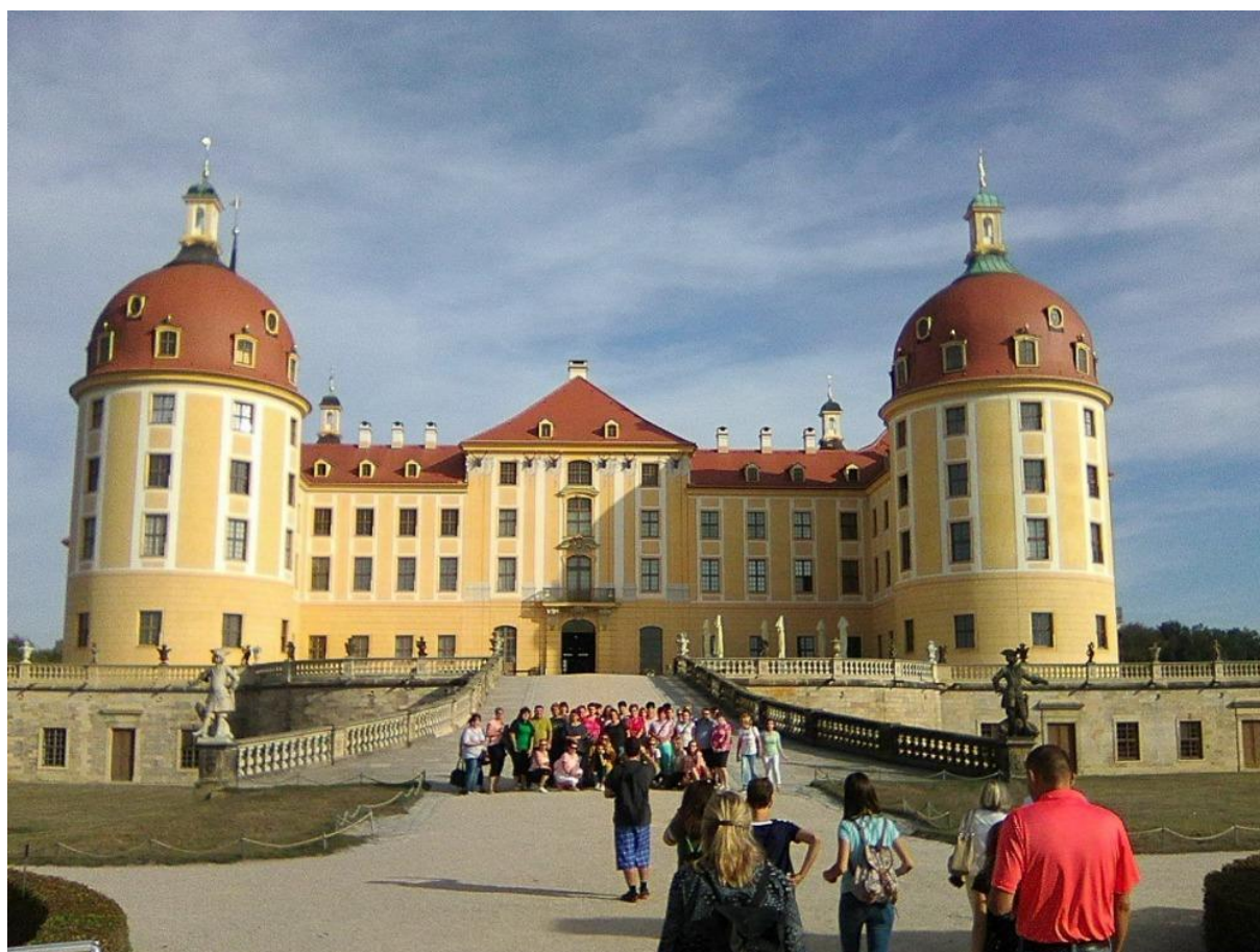
Hromadné foto před zámkem Moritzburg žáků SOU Domažlice a RS Neunburg vorm Wald