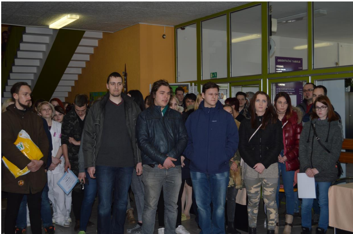
Klíč k příležitostem - Berufsinfomesse