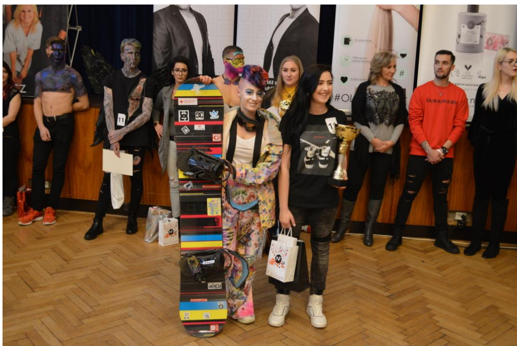
Vítězný model soutěže Beauty Cup 2019