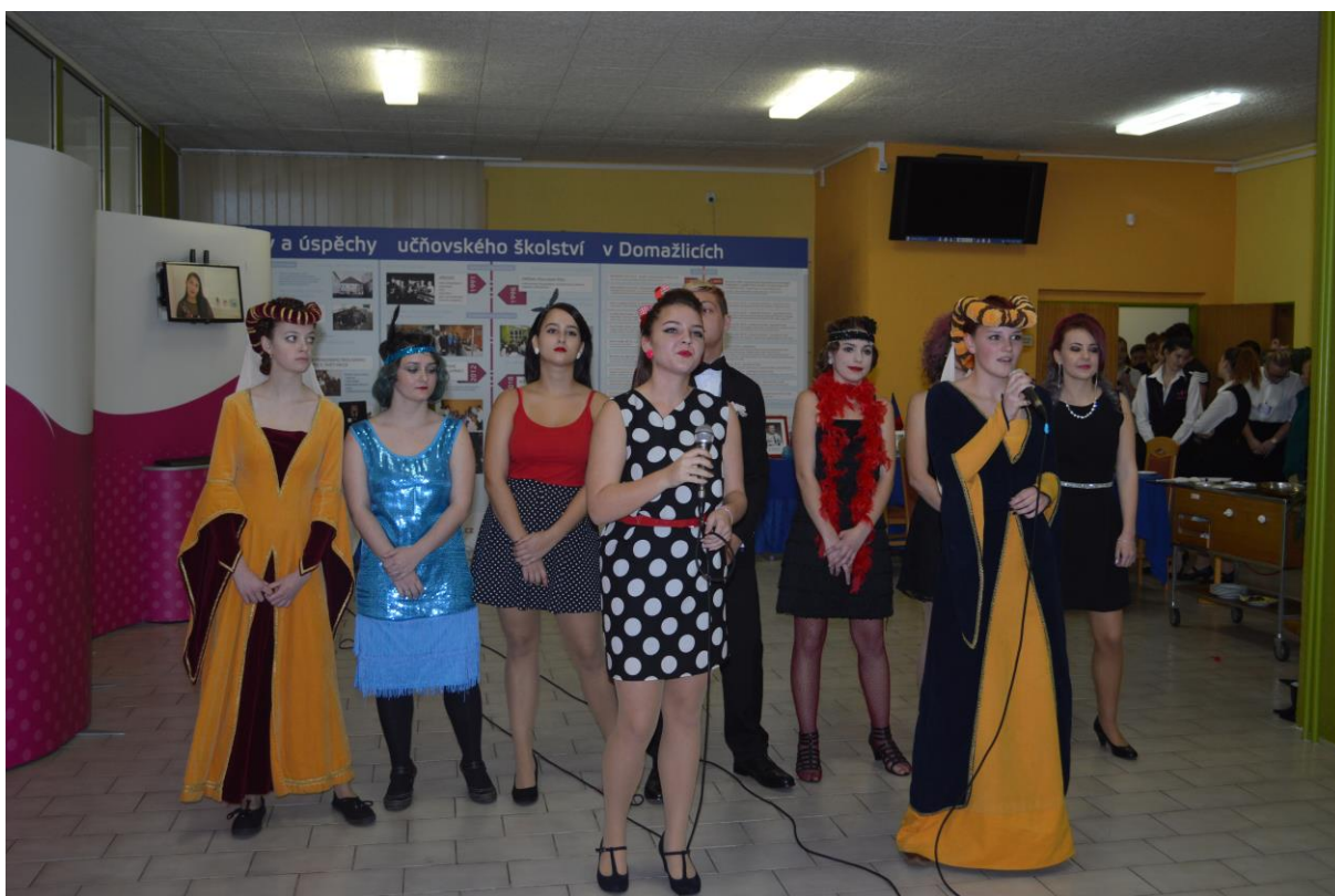
Vystoupení kadeřnic na DOD 16. 11. 2018