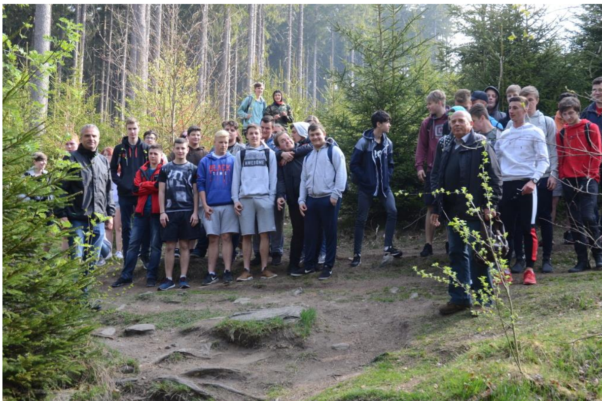
U pramene řeky Radbuzy

Všechny třídy na teoretickém vyučování se zapojily a každá třída si den užila dle svého. Někteří vyrazili na pěší výlety do okolí (Baldov, Zelenovské rybníky), další tři třídy vyjely na exkurzi k pramenu řeky Radbuzy, a v neposlední řadě se taktéž uklízelo kolem areálu školy.