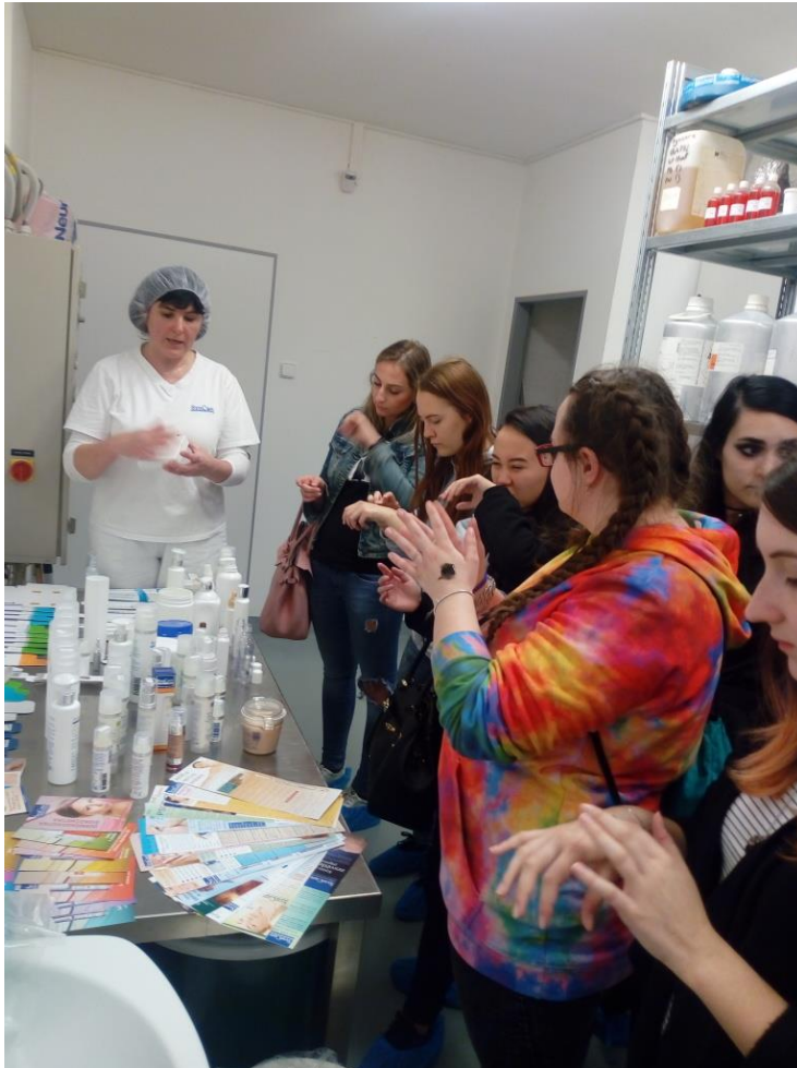
Jednotlivé přípravky si mohly žákyně 4. ročníku vyzkoušet.

Začátkem března představila zástupkyně firmy Syn Care kosmetické přípravky a produkty žákyním 2. a 4. ročníku oboru kosmetické služby. SynCare je spojení řecké předpony syn – k nebo pro – a anglického slova care – péče. Vyjadřuje přesvědčení, že kosmetika SynCare by měla být významným celoživotním pomocníkem v péči o pleť pro ženy i muže. Následně se v měsíci dubnu žákyně 4. ročníku podívaly přímo do firmy, kde se tyto přípravky vyrábějí, plní a distribuují.