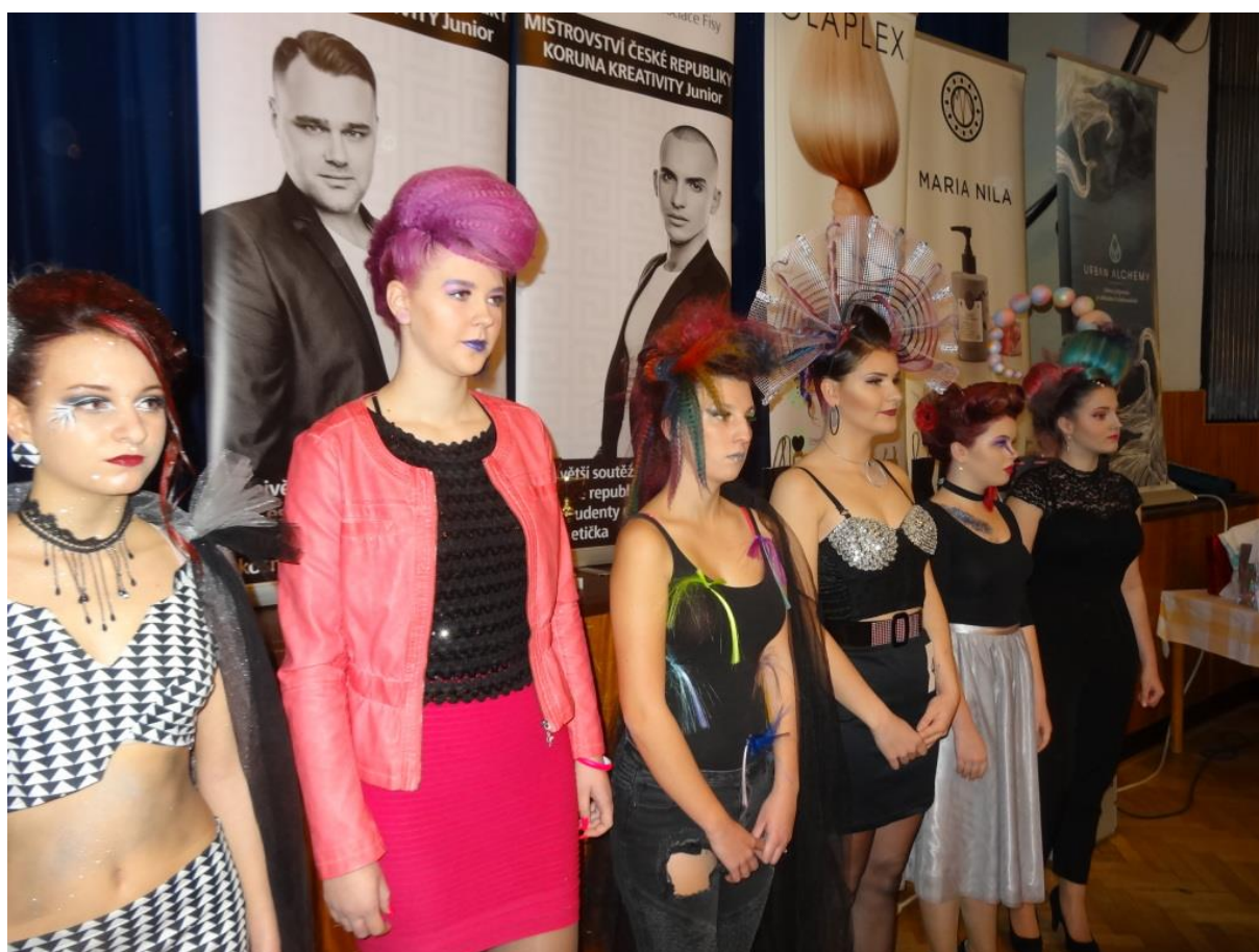
Ze slavnostního vyhodnocení soutěže Beauty Cup 2019 pořádanou Středním odborným učilištěm Domažlice, téma Fifty Shades of Colours